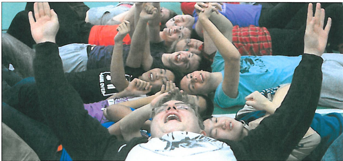
Hópefli í íþróttahúsi

Ýmsar leiðir voru farnar til að hrista saman nemendahópinn bæði til að opna samskiptin og efla félagstengsl. Í upphafi verkefnis höfðum við skemmtikvöld til að hrista hópana saman. Nemendur skipulögðu sjálfir ýmsa leiki og ísbrjóta þar sem markmiðið var að læra nöfn allra og kynnast á nýjum forsendum. Nemendur komu með fjölbreyttan mat frá heimalandi sínu og má segja að fjölskrúðug og litrík menning hafi lífgað upp á gráma hversdagsins. Annað sem við gerðum til að undirbúa hópinn undir verkefnið var að við skiptum hópnum í nokkra litla 10 manna hópa og héldum örnámskeið fyrir hópana þar sem við kynntum fyrir þeim hvað það felur í sér að vera menor og mentís og mikilvægi samstarfsins. Nemendur tjáðu einnig sína upplifun á fjölmenningu skólans. Seinni hluta haustannar var haldið skemmtikvöld tileinkað jólasíðum, íslenskir nemendur kynntu ýmsar jólahefðir á Íslandi og hinir erlendu ýmsar hátíðarhefðir frá sínu heimalandi. Þar var einnig fjölmenningarlegur matur á borðum. Á tímabilinu var farið í ýmsa leiki til að efla andann og styrkja samskiptin svo sem hópefli og ratleiki jafnt innan dyra sem utan. Verkefninu lauk með vorferð.