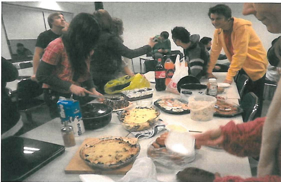
Skemmtikvöld mentora og mentísa