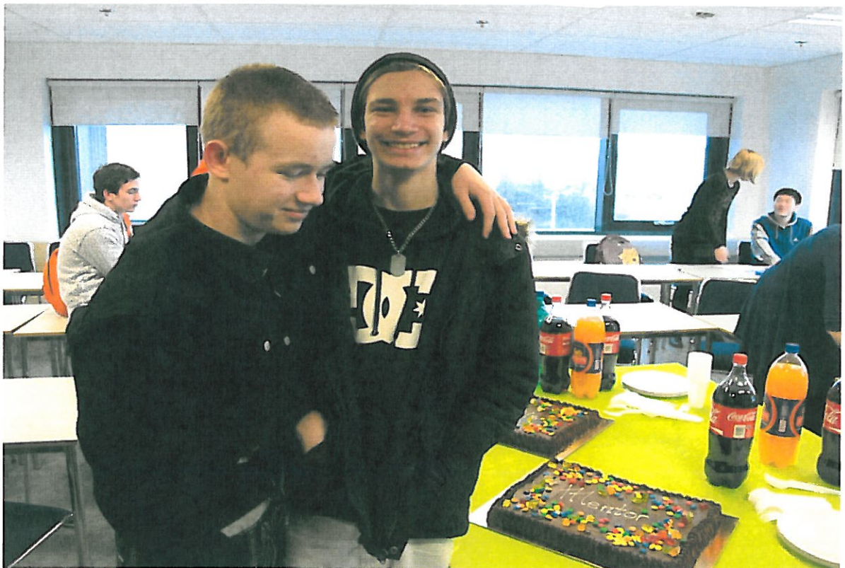
Lokahóf verkefnisins undirbúið

Verkefnið hefur nú þegar haft margvísleg áhrif á skólastarfið í heild sinni. Með mentorkerfinu er kominn vettvangur fyrir íslenska nemendur að nálgast erlenda nemendur á óþvingaðan og eðlilegan máta. Ánægja nemenda með starfið spyrst út og er verkefnið nú orðið nokkuð þekkt meðal annarra nemenda í skólanum. Margir sýna verkefninu áhuga og skapar það jákvæða umræðu um mikilvægi fjölmennningarinnar. Einnig má segja að mentor áfanginn minnki álag á kennurum skólans sem í mörgum tilfellum hefur verið ærið. Margir kennarar sem kenna nemendum af innflytjendabraut hafa haft áhyggjur af því að kennslan skili sér ekki fullkomlega til þeirra vegna tungumálaörðugleika og finnst gott að vita að nemendur fái aðstoð við heimanám í formi mentorvinnunnar.