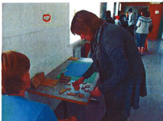
Foreldri reynir sig við þúsluspilið

Að færa út landamæri getu sinnar og þekkingar