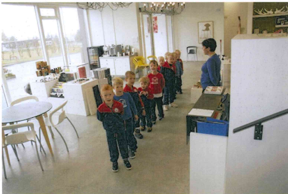
Beðið stillt í röð í Hönnunarsafninu áður en haldið er í hljóðfærasmiðjuna.