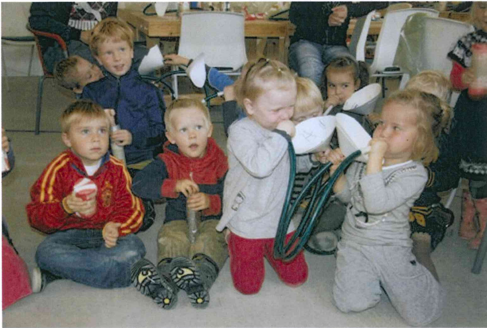
Blásið af fullum krafti í nýju blásturshljóðferin.