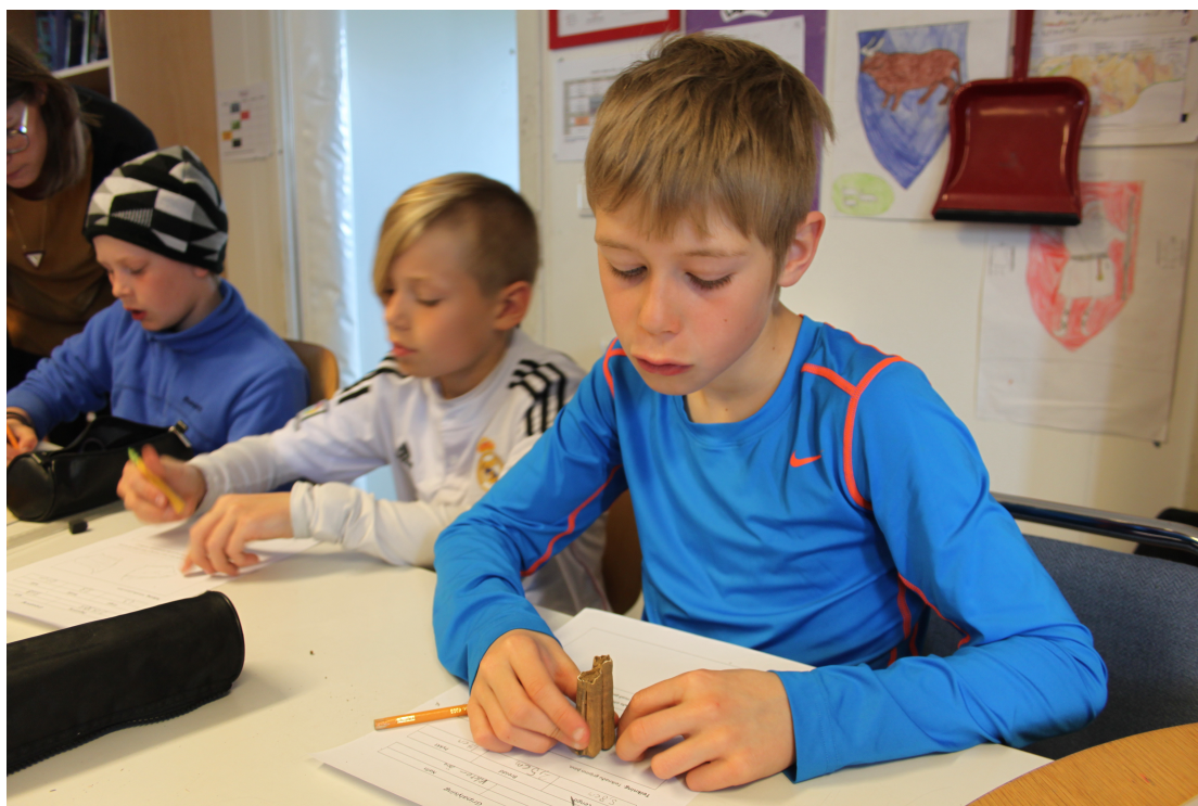
Mynd 4: Nemendur vinna með gripina sem þeir fundu á vettvangi.