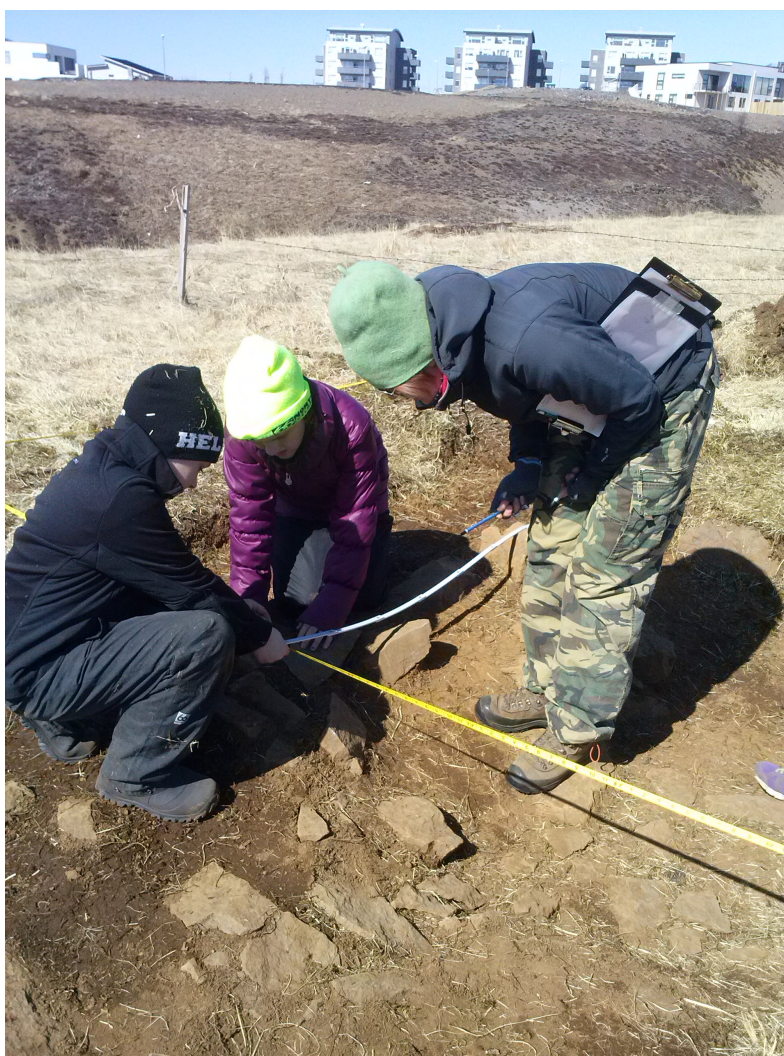
Mynd 1: Rústirnar teiknaðar upp í kvarðanum 1:20 með aðferðum fornleifafræðinnar.

Að vettvangsvinnunn lokinni unnu fornleifafræðingarnir áfram með nemendum inni í skólastofu. Sú vinna fór fram 21. maí. Þar skoðuðu nemendur þá gripi sem þeir höfðu fundið við sigtunina. Her nemandi skráði, lýsti og teiknaði tvo gripi. Unnið var orðaský þar sem nemendur rifjuðu upp ný hugtök sem þeir höfðu lært við verkefnisvinnuna. Að lokum skrifuðu þeir sögu um lífið á Úlfarsá fyrir á öldum og notuðu til þess þá þekkingu sem þeir höfðu aflað sér í gegnum fornleifarnar á jörðinni.