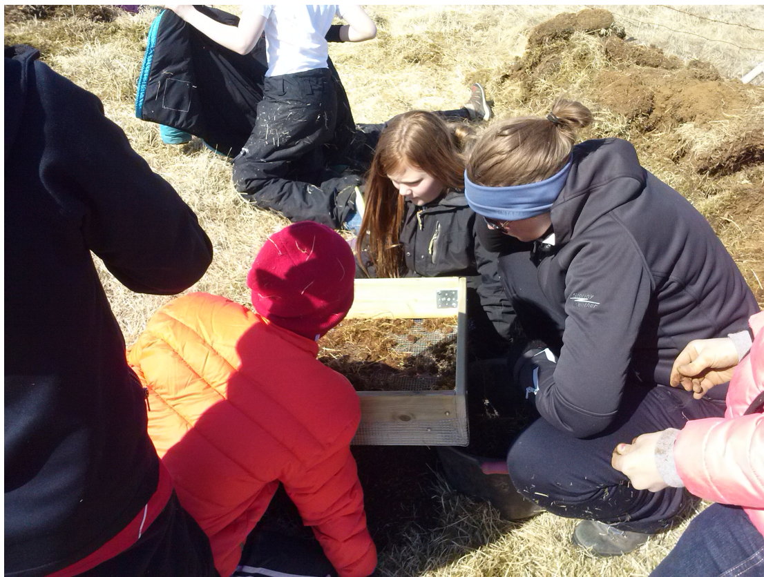
Mynd 2: Nemendum þótti skemmtilegt að sigta jarðveginn úr uppgreftrinum í leit að gripum.