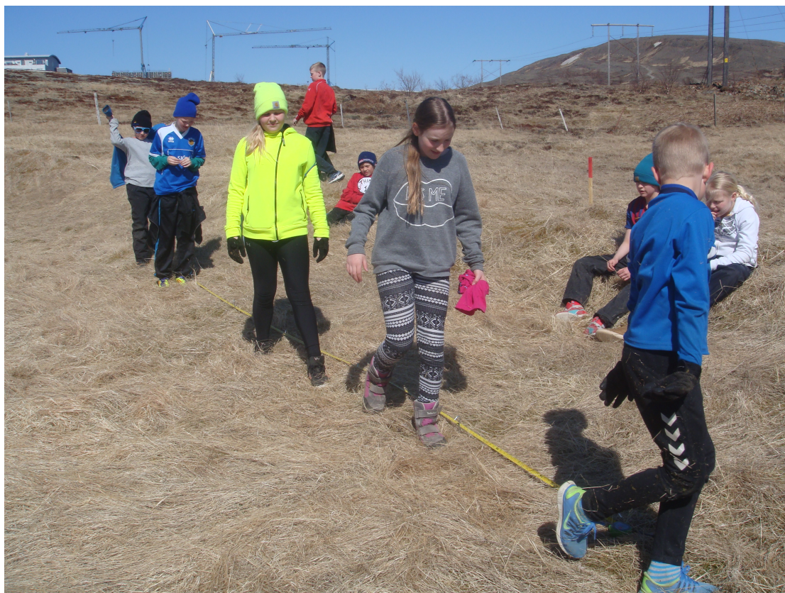
Mynd 3: Nemendur æfa sig í að stika vegalengdir.