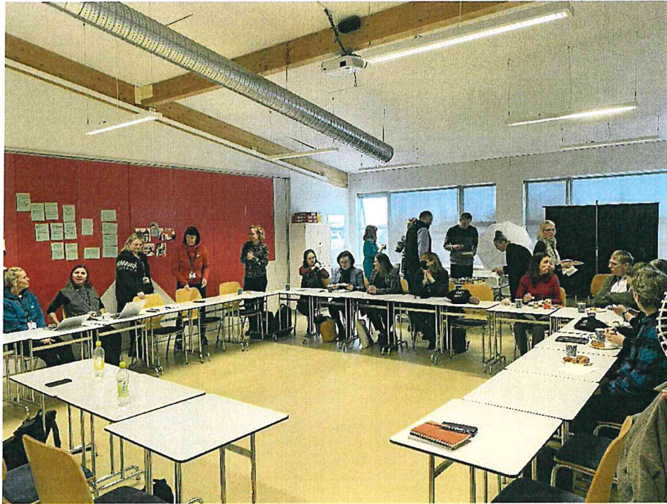
Mynd 4 Sýnir frá fundi starfsþróunarhópa FS og MS þann 7. mars síðastliðinn

Þátttakendur í starfsþróunarhópnum skiluðu af sér greinargerð í lok hvorrar annar. Sjö kennarar skiluðu af sér greinargerð á haustönninni og sex kennarar á vorönninni. Fundir hópsins voru öllum opnir þannig og gat fólk komið og fylgst með vinnunni sem fram fór á fundunum. Hugmyndir eru uppi meðal skólastjórnenda að útvíkka þetta starf með því að bjóða upp á starfsþróunarklúbba á næsta skólaári. Þar myndu kennarar velja sér ýmis starfsþróunarviðfangsefni í formi klúbbs til að vinna með yfir skólaárið. Þeir sem hefðu áhuga á svipuðu viðfangsefni myndu þá funda reglulega yfir skólaárið.