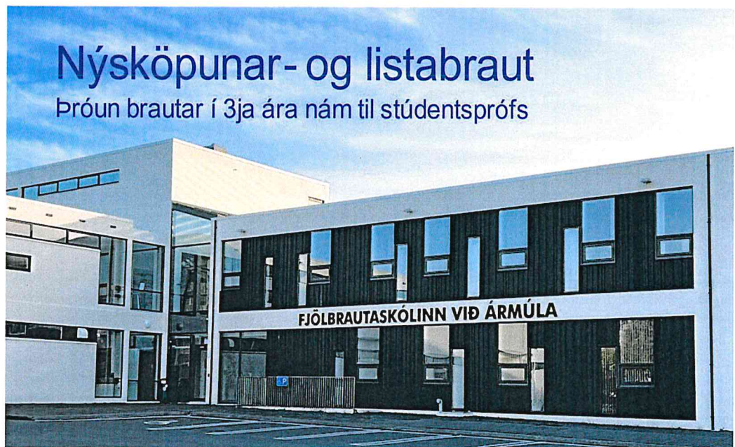
FJÖLBRAUTASKÓLINN VIÐ ÁRMÚLA 2022