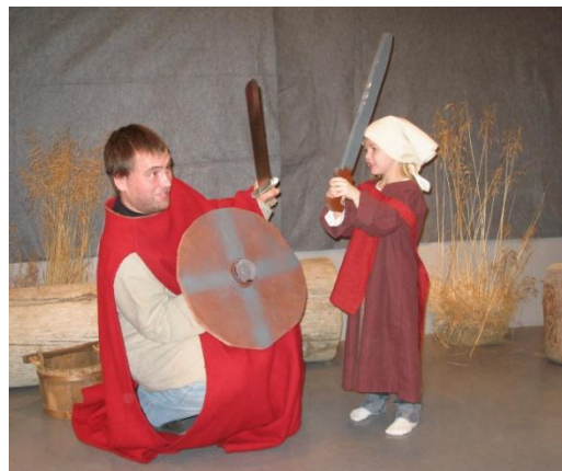
Samstarf við Safnastofnun Austurlands. Á myndinni t.v. er unnið með sögu bæjarins. Myndin t.h. er tekin þegar nemendur buðu feðrum sínum á minjasafnið á feðradaginn í nóv. 2009.