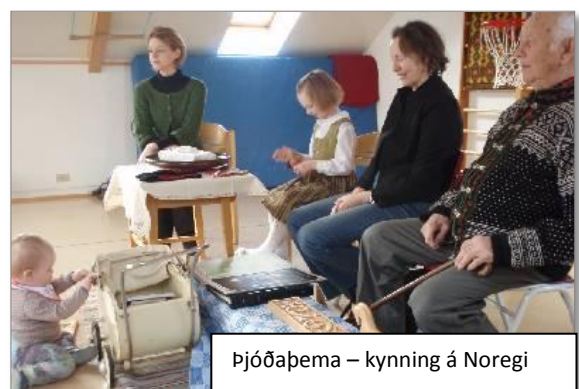
Þjóðapema – kynning á Noregi