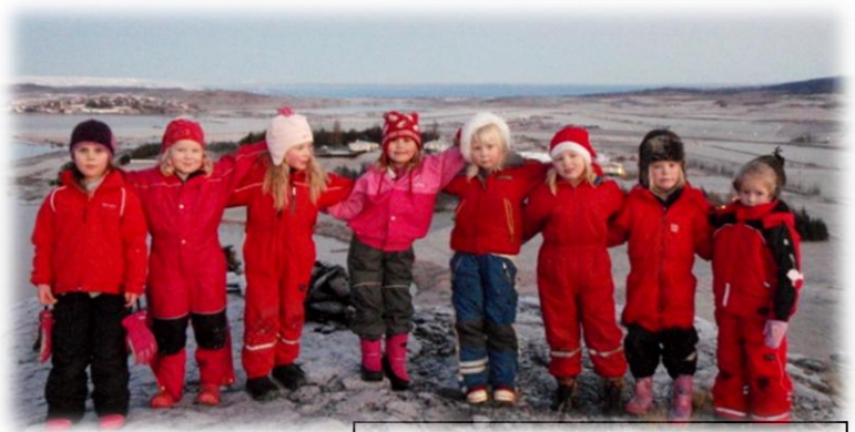
Vettvangsferð á Egilsstaðakoll í des. 2009

Engin könnun hefur farið fram á því hvernig þróunarstarfið hefur skilað sér til nemenda sem hafa útskrifast frá Tjarnarlandi, en ef dæma má af frásögnum foreldra nokkurra þeirra nemenda, má ætla að þróunarstarfið hafið skilað sér að einhverju leyti, s.s. í meiri áhuga þeirra á umhverfi og náttúru og sögu bæjarins.