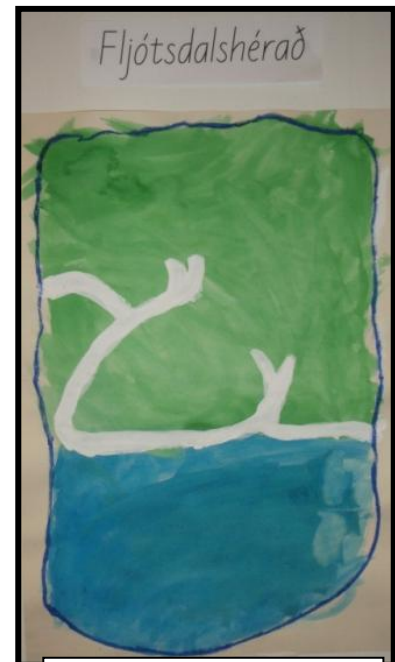
Skjaldarmerki Fljótsdalshéraðs unnið af nemendum.

Eins og hér má sjá er lögð áhersla á að þróa fjölbreyttar og lifandi leiðir í skólastarfi með 5 ára nemendum og að nýta þau félagslegu og menningarlegu tækifæri sem felast í umhverfinu. Lögð er áhersla á að styrkja umhverfis, samfélags- og söguvitund nemenda og efla orða- og hugtakanotkun þeirra í gegn um fjölbreytilegt samstarf við ýmsa aðila í samfélaginu. Í bakgrunni þessa verkefnis liggja fyrst og fremst uppeldis- og kennslufræðileg sjónarmið en einnig félagsleg, þar sem nemendur kynnast, tengjast og öðlast öryggi í því umhverfi sem þeir alast upp í.