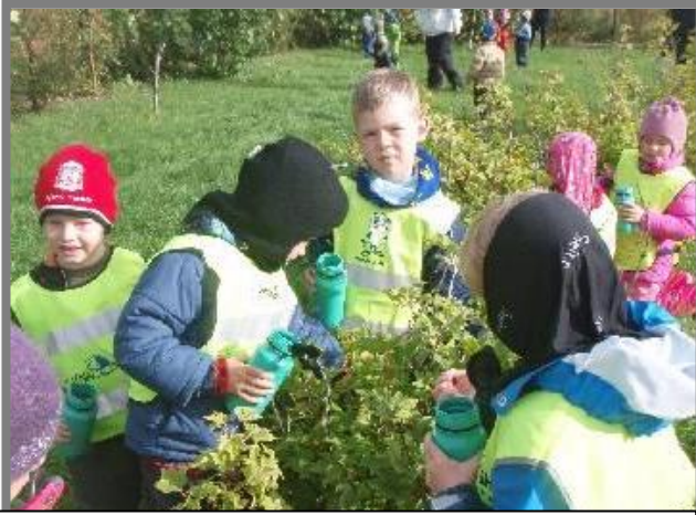
Nemendur tína rífsber í leikskólanum Skógarlandi