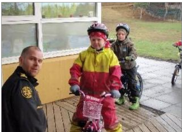
Eitt af föstum samstarfsverkefnum Tjarnarlands er við lögregluna á hjóladag nemenda á vorin. Þá mætir lögreglan og fræðir nemendur um helstu hjólareglur og skoðar öll hjól nemenda.

Í mati starfsmanna í nóv. 2010 kemur fram að verkefnið hafi sannarlega haft áhrif á skólastarfið í heild. Fram kom að það að fara í formlegt þróunarverkefni með verkefnisstjóra, hafi leitt til þess að unnið var markvisst að framgangi verkefnisins, þrátt fyrir þá erfiðleika sem upp komu.