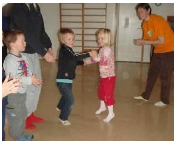
Samstarf við Þjóðdansafélagið Fiðrildin.