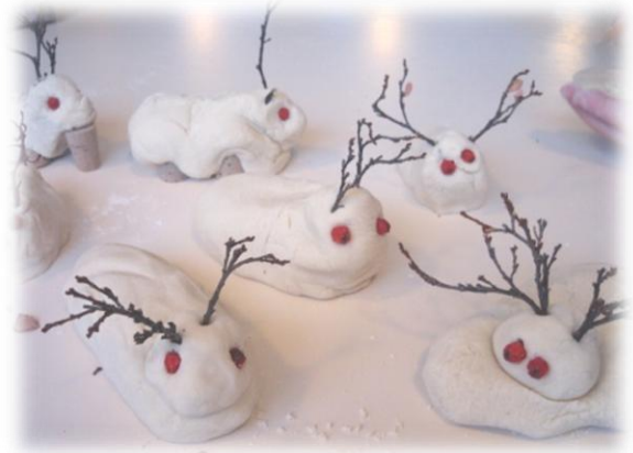
Hreindýrin eru afrakstur hreindýradaga þar sem unnið var með sérkenni svæðisins

Eins og áður sagði var farin sú leið að fá gesti inn í leikskólann til að styrkja samskipti nemenda við samfélagið. Auk vina okkar eldri borgara hafa ýmsir íbúar í samfélaginu komið þar við sögu. Mætti þar t.d. nefna gesti sem komið