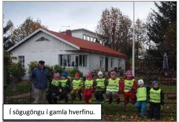
Í sögugöngu í gamla hverfinu.

einstaklingsmat sem byggt var upp á ljósmyndum af helstu viðfangsefnum haustannar tengt þróunarstarfinu. Eftir upprifjun og umræðu um myndirnar (hverja mynd) voru nemendur spurðir um hvernig þeim líkaði við viðburðinn og gátu þeir valið um að benda á þrjá broskarla með stigvaxandi brosi eftir því hvernig þeim líkaði.