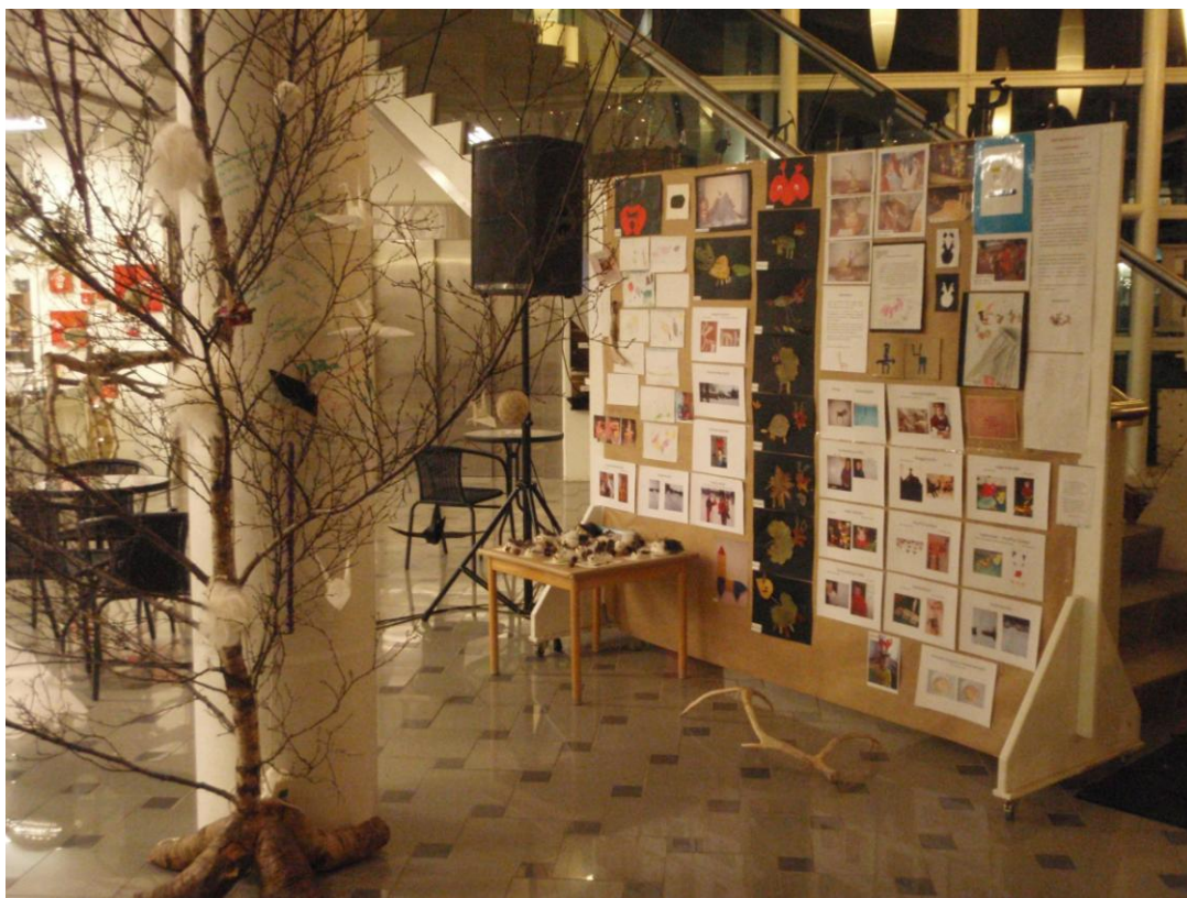
Af hreindýrasýningu sem haldin var í anddyri Níunnar í des. 2010.