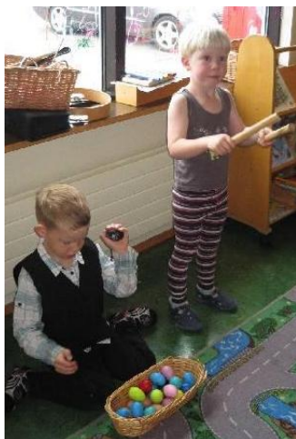
Tónlist og dans í Tjarnarlandi