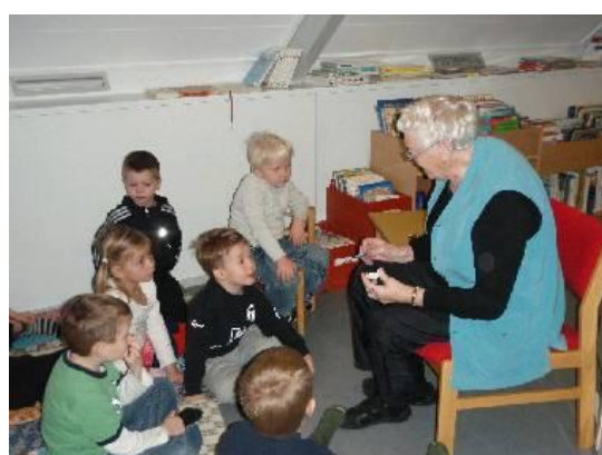
Samstarf við Félag eldri borgara á Fljótsdalshéraði. T.v. er bókastund í leikskólanum en t.h. er eldri borgari að segja söguna Leggur og skel á bókasafni Héraðsbúa í tilefni Dags íslenskrar tungu.