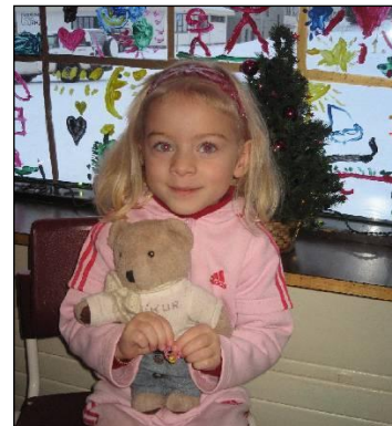
Nemandi nýkominn með bangsa úr helgarheimsókn

Við teljum að starfshættir þeir sem starfsfólk Tjarnarlands hefur einsett sér að nota í starfi og tengist að mestu leyti hugmyndafræði Reggio Emilia, hafi styrkt sjálfsmynd nemenda á þeim tíma sem þróunarstarfið hefur staðið yfir. Má þar nefna nemendur sem hafa átt við tilfinningalega erfiðleika að etja, auk nemenda með erfiða hegðun, sem hafa með skýrum markmiðum og samræmdum starfsháttum náð að blómstra hér í skólastarfinu.