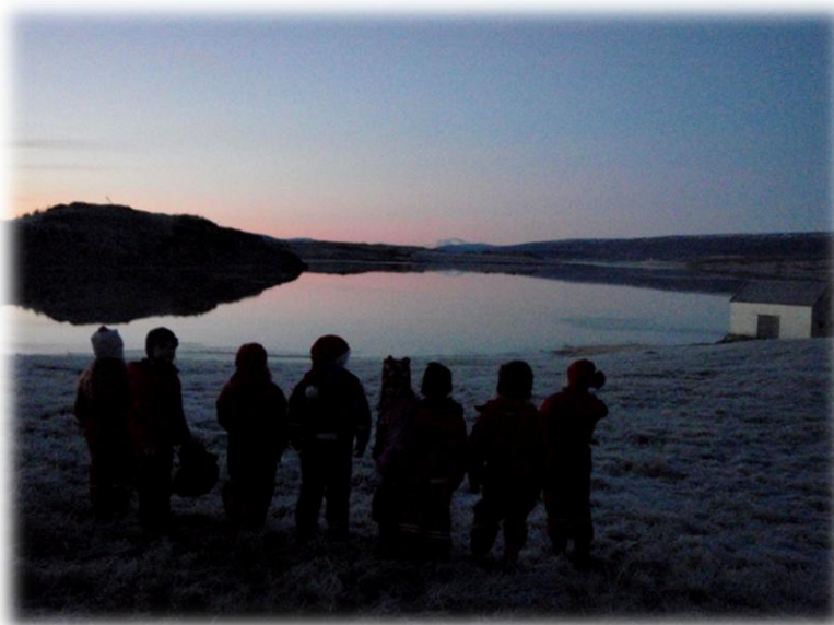
Í vettvangsferð við Lagarfljótið í desember 2009. Snæfellið speglast fallega í Fljótinu í morgunskímunni. Síðan var gengið á Egilsstaðakoll ( t.v. á myndinni).

Eins og hér má sjá er lögð áhersla á að þróa fjölbreyttar og lifandi leiðir í skólastarfi með 5 ára nemendum og að nýta þau félagslegu og menningarlegu tækifæri sem felast í umhverfinu. Lögð er áhersla á að styrkja umhverfis, samfélags- og söguvitund nemenda og efla orða- og hugtakanotkun þeirra í gegn um fjölbreytilegt samstarf við ýmsa aðila í samfélaginu. Í bakgrunni þessa verkefnis liggja fyrst og fremst uppeldis- og kennslufræðileg sjónarmið en einnig félagsleg, þar sem nemendur kynnast, tengjast og öðlast öryggi í því umhverfi sem þeir alast upp í.