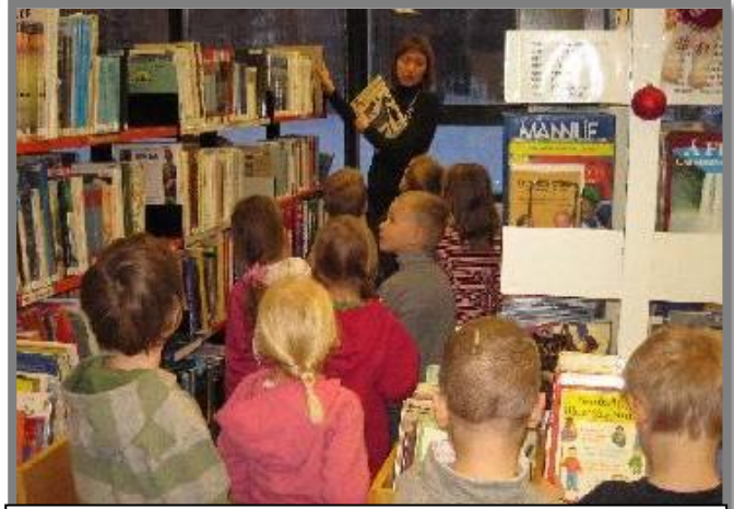
Nemendur í heimsókn í bókasafni Egilsstaðaskóla