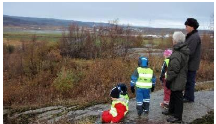
Í sögugöngum fylgja eldri borgarar nemendum um umhverfið og segja t.d. frá því þegar bærin var að myndast. Þá er gengið í gegnum gamla bæinn og nöfn gömlu húsanna rifjuð upp.