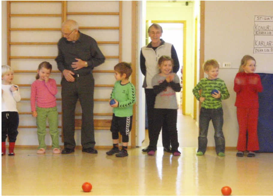
Á hinu árlega bocciamóti nemenda Tjarnarlands og eldri borgara sem fram fer í sal Tjarnarlands.

Á vetrargleði fagna nemendur og eldri borgarar saman vetrarkomu hvert ár (sjá myndir að neðan og t.h.).