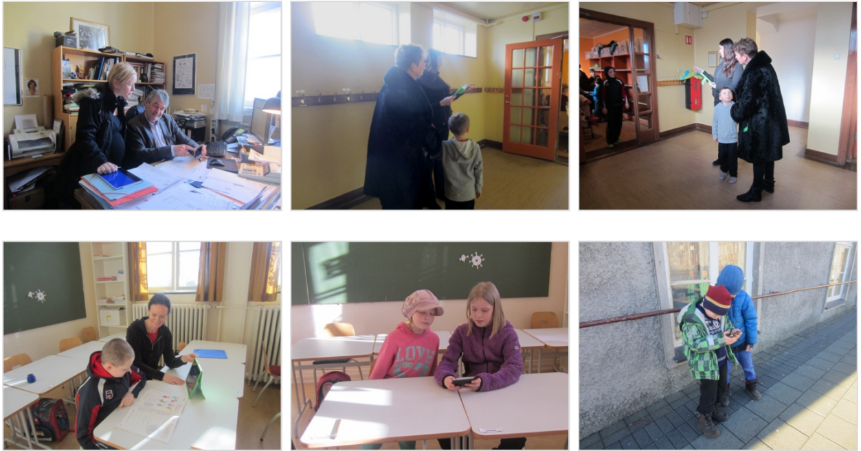
Myndir sem sýna samskipti foreldris og stjórnenda (skrifstofa), foreldris og kennara (gangar skóla), kennara og nemenda (skólastofa) og nemenda (skólastofa og skólalóð)