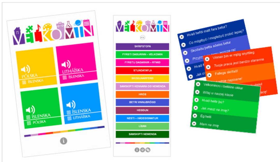
Skjámyndir af hljóðsetta samskiptaorðaforðanum á www.tungumalatorg.is/velkomin

Fyrirnefndir gátlistar sem eru aukaafurð af verkefninu eru vistaðir á vef Tungumálatorgsins http://tungumalatorg.is/sk/gatlistar . Um er að ræða 12 gátlista sem tengjast eftirfarandi viðfangsefnum: félagsleg aðlögun, móttaka, almennur hluti, móðurmál, nám og kennsla, námsmat, vefur skóla, ráðgjöf og aðstoð, samstarf, símenntun, þróunarverkefni og túlkþjónusta.