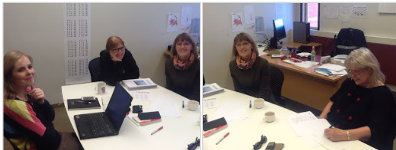
Myndir frá rýnihópsfundi kennara þar sem íslensk þýðing efnisins var til skoðunar. Kennsluráðgjafar víða um land fengu jafnframt efnið til umsagnar.