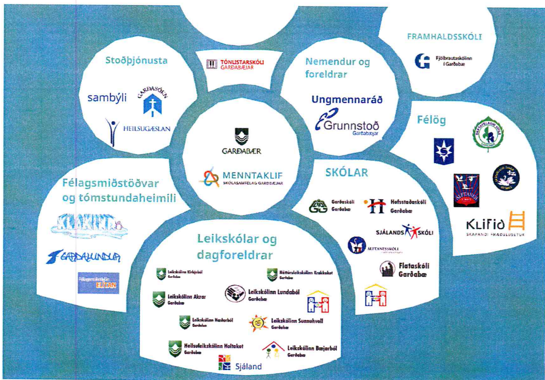
Mynd 1 Samráðshópurinn

Veturinn 2013 – 2014 þróaðist verkefnið og skilgreining Vitundarvakningarinnar varð víðari. Við það tekur verkefnið einnig til líkamlegs og andlegs ofbeldis ásamt vanrækslu og áhættuhegðunar barna og ungmenna. Verkefnið nær nú einnig til þátta sem lúta að jafnrétti og mannréttindum.