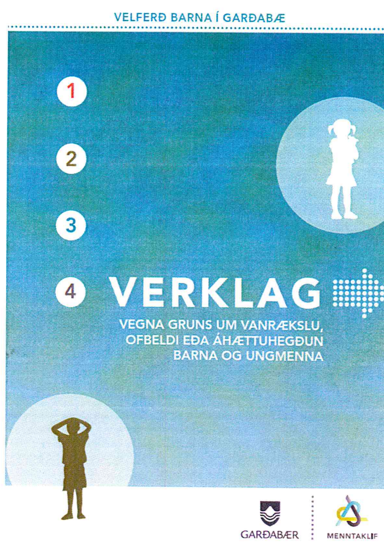
Mynd 4 Handbók um verklag

Í handbókinni eru þau fjögur stig sem greint er frá á skýringarmyndinni útskýrð nánar. Henni verður dreift til starfsmanna haustið 2015 um leið og þeir fá kynningu á nýja verklaginu. Tvö grunnnámskeið eru fyrirhuguð í framhaldi af kynningunni. Námskeið A er helgað verklaginu. Námskeið B er námskeið um kynheilbrigði. Þróun þeirra er fer fram haustið 2015. Starfsmenn munu sækja námskeiðin árið 2016-2017 ef nægt fjármagn fæst til innleiðingarinnar.