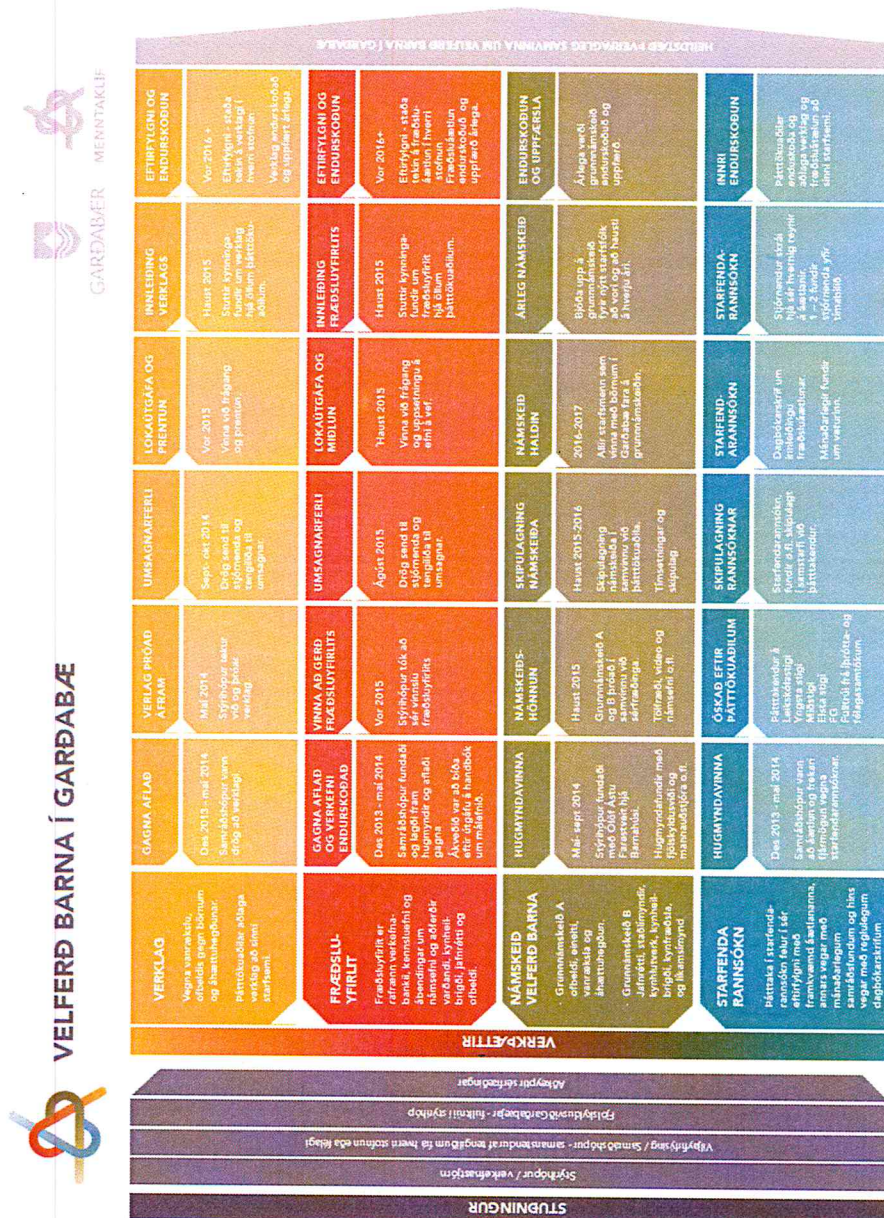
Mynd 2 Áætlun um innleiðingu verkefnisins Velferð barna

Á mynd 2 er verkefnaáætlunin í heild sinni. Þar sem verkefnið er mjög víðamikil reyndist nauðsynlegt að afla frekari styrkja til námskeiðshönnunar og innleiðingar á námskeiðum meðal starfsmanna sem vinna með börnum og ungmennum í Garðabæ.