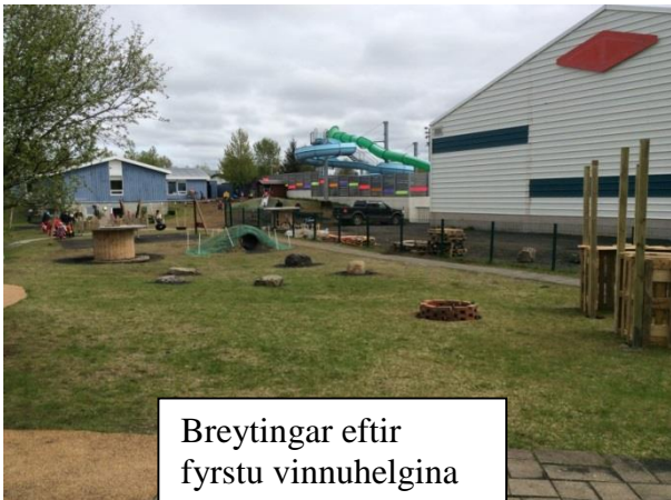
Breytingar eftir fyrstu vinnuhelgina