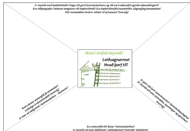
Mynd 6. Verkfæri til að kortleggja stöðu leiðsagnarmats í teymi