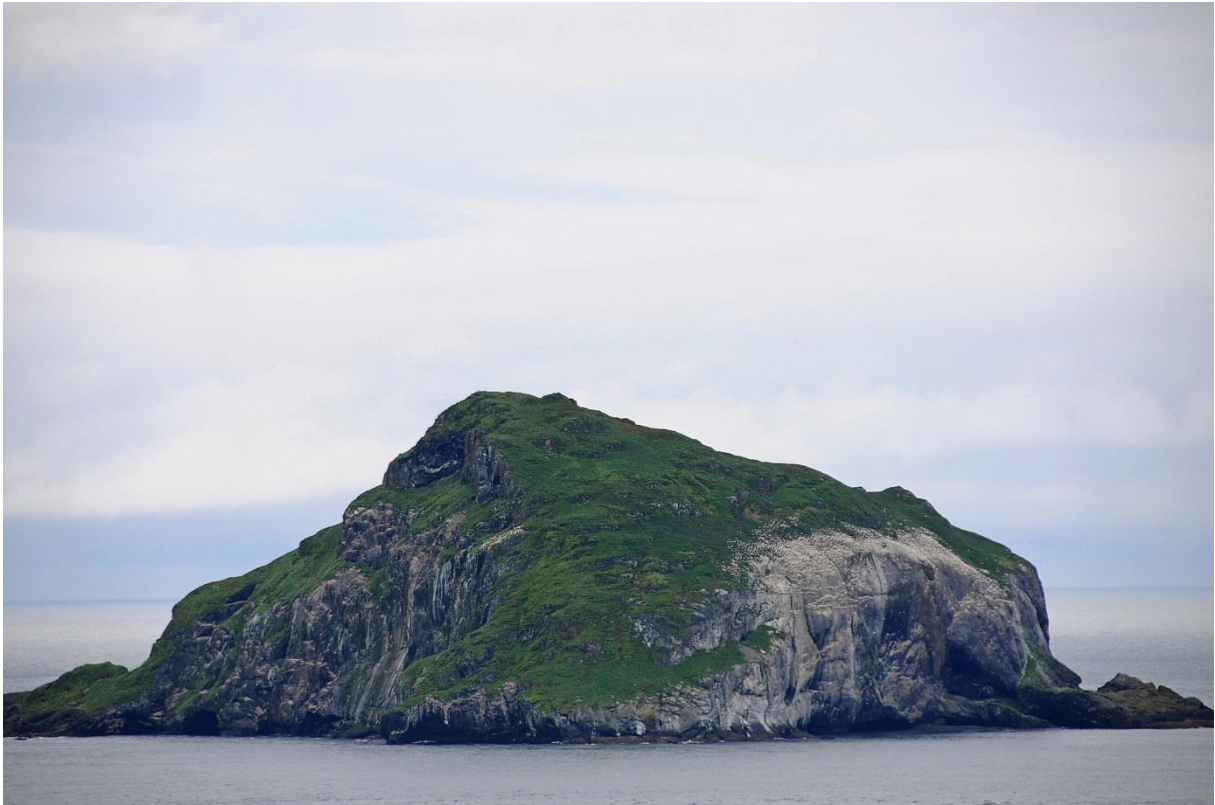
Skrúður - Aðalheiður Jónsdóttir

Í framhaldi af innleiðingu Byrjendalæsis og verkefnisins „Bættur námsárangur á Austurlandi“