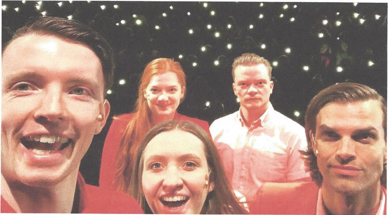
Sjálfa með nemendum í Hofi, Akureyri

Fjölbrautaskólinn í Garðabæ í samstarfi við Leikhópinn Smartílab