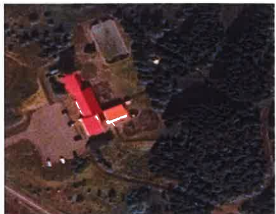
Grunnkortið sem nemendur fengu með í leiðangurinn. Inn á kortið sitt fengu þau síðan punkta sem þau áttu að finna og þar voru stöðvarnar.

Athugasemdir: Tíminn gekk mjög vel fyrir sig. Nemendur voru áhugasamir og virkir. Eftir að inn var komið var nóg að vera með umræður því bæði var lítill tími til að byrja á verkefnunum í bókinni Könnum kortin sem og að nemendur voru ekki eins til í að fara í vinnubókarvinnu eftir að hafa verið í skemmtilegri vinnu úti.