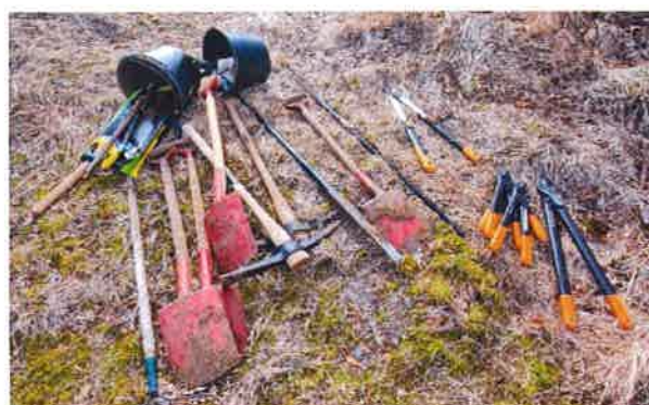
Mynd 1: dæmi um verkfæri fyrir 6-8 mann vinnuhóp í göngustígagerð

Innihald: Kennari Ferðamáladeildar velur viðfangsefni svo sem að búa til tréprep á göngustíg út frá leik- og grunnskóla. Náttúra Íslands er viðkvæm, vaxtartími er stuttur, jarðvegur er rofgjarn. Því getur aukið álag vegna gangandi ferðamanna haft töluverð áhrif ef ekki er rétt staðið að hönnun göngustíga. Góður undirbúningur er því ákaflega mikilvægur og þarf að huga að mörgu. Því þarf að íhuga mjög vel að staðarvali (sé verið að leggja nýjan göngustíg) og athuga að göngustígur falli inn á náttúruna og sé á réttum stað, þannig að göngustígur hlífi þá náttúru í kring (sjá t.d. mynd 2). Það getur því verið betra að velja göngustíg sem er til staðar og þarf að gera við eins og hér var tilfellið (samanber dæmi um slíkt á mynd 3).