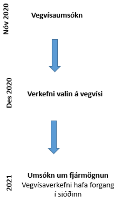
Mynd 1. Áætlað verkferli vegna vegvísis um rannsóknarinnviði.

Til stendur að vegvísir um rannsóknarinnviði verði uppfærður á 2 – 5 ára fresti.