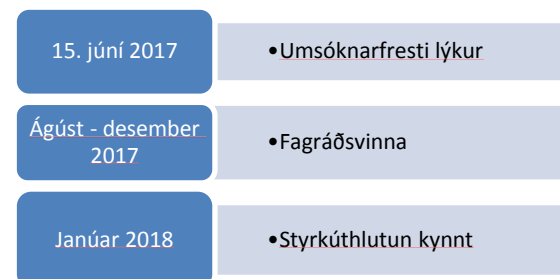
Mynd 1. Áætlaðar tímasetningar fyrir styrkárið 2018.

Umsóknarfrestur fyrir umsóknir í Rannsóknasjóð er auglýstur með a.m.k. 6 vikna fyrirvara. Áætlaðar tímasetningar fyrir umsýsluferli umsókna fyrir styrkárið má sjá á mynd 1.